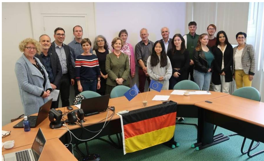
Courrier de l'Ouest –Fabien LEDUC. Publié le 06/05/2023 à 16h00

Cholet, lycée Europe, vendredi 5 mai 2023. La délégation allemande et des enseignants du lycée Europe ont écouté le retour d'expérience de lycéens choletais partis à l'étranger.