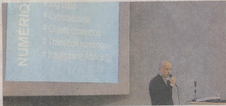
Les ateliers étaient animés par des enseignants et des étudiants de l'école d'ingénieurs Esaip, basée dans la métropole d'Angers.