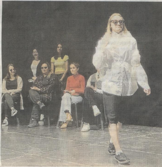
Cholet, mardi 9 mai. Les jeunes ont rivalisé d'imagination pour créer la chemise d'Harpagon, le personnage principal de « L'Avare », la pièce de Molière.