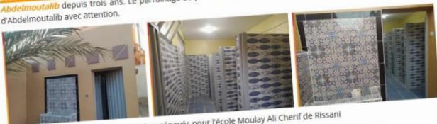
Sanitaires rénovés pour l'école Moulay Ali Cherif de Rissani