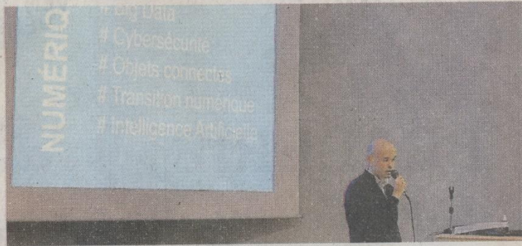
Les ateliers étaient animés par des enseignants et des étudiants de l'école d'ingénieurs Esaip, basée dans la métropole d'Angers.