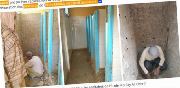
Début des travaux pour les sanitaires de l'école Moulay Ali Cherif de Rissani.

2400€ ont pu être récoltés lors de cette course solidaire. Cette somme a permis à notre association de financer la rénovation des sanitaires de l'école Moulay Ali Cherif de Rissani .