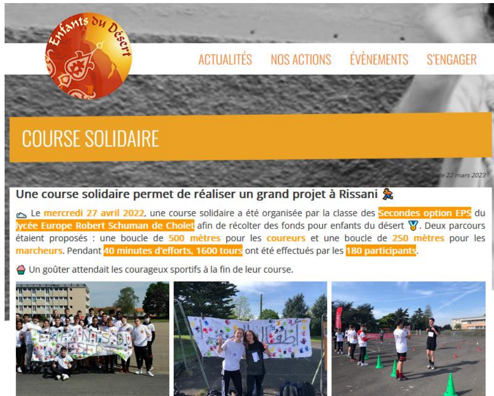
Course solidaire au lycée Europe de Cholet

2400€ ont pu être récoltés lors de cette course solidaire. Cette somme a permis à notre association de financer la rénovation des sanitaires de l'école Moulay Ali Cherif de Rissani .