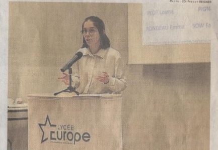
Au lycée Europe, seize jeunes ont rivalisé d'idées et de courage pour la 6 e édition du concours d'éloquence. PAGE 8