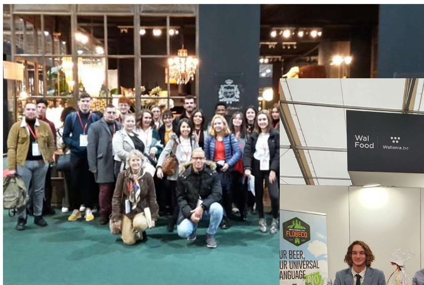
Maison et objets