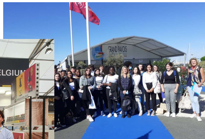
Le grand pavois