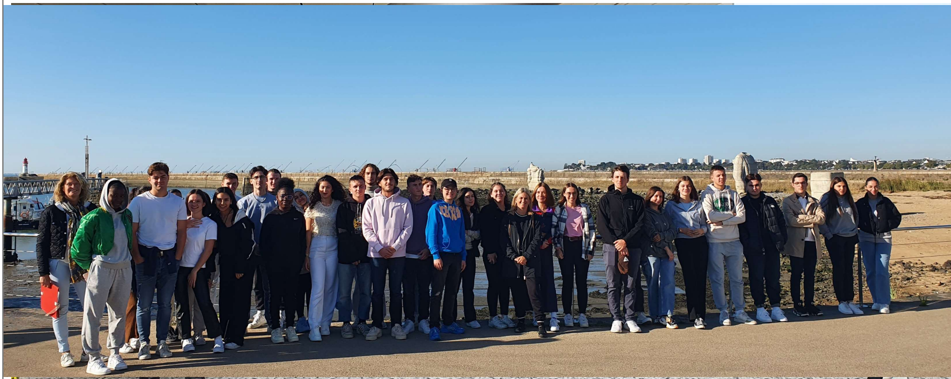
Port de St Nazaire

Visites : Visites d'entreprise et de ports de commerce