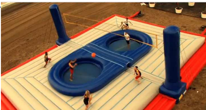
Match de Bossaball

Dans tous ces exemples, on peut voir que tous les sports peuvent être techniques, compétitifs ou encore amusants, et que même s'ils restent encore méconnus du grand public, ils peuvent être intéressants et divertissants. Cependant la liberté de pratique de ces sports, même dans leur pays d'origine, reste encore parfois limitée par le manque d'équipement et de ressources financières. Les fonds manquent notamment pour organiser de grands événements qui permettraient d'augmenter leur notoriété.