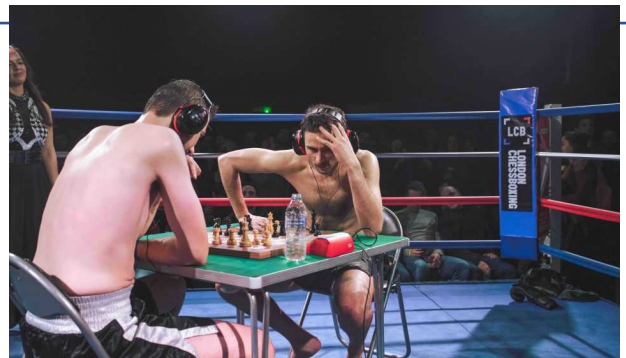
Match de Chessboxing