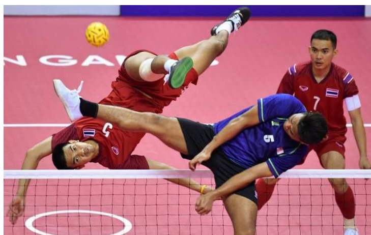
Match de Sepak takraw

Nous avons choisi cette fois-ci de vous présenter des sports moins connus que le football, le basketball ou le tennis. Ces sports peuvent être tout aussi intéressants et compétitifs que leurs homologues plus populaires. Nous les avons choisis en fonction de nos préférences en termes de difficulté ou d'amusement ou encore de possibilité de pratique. De plus nos critères ont varié en fonction de la popularité et de la liberté de pratique de ses sports (dans leurs pays d'origine). Voici notre sélection :