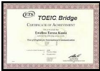
Le TOEIC Bridge (Test international de positionnement en Anglais)