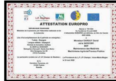
L'option facultative MOBILITEPRO en terminale valide une période de formation effectuée dans un pays de l'UE : des points en plus pour le bac.